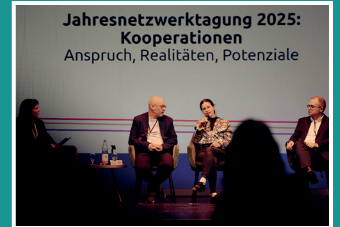
Jahresnetzwerktagung 2025: Kooperationen Anspruch, Realitäten, Potentiale